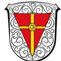
Rudolf Stricker, Attribution, via Wikimedia Commons

Unsere Juni-Wanderung ist nochmals etwas zum „Einlaufen“. Die Wanderung führt uns rund um Bruchköbel auf leider anfänglich vielen asphaltierten Wegen.