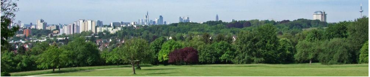
Panorama von Seckbach mit Hufelandhaus, Huthpark und BG-Unfallklinik, Bornheim mit St. Katharinenkrankenhaus und der City von Ffm vom Lohrberg aus gesehen.