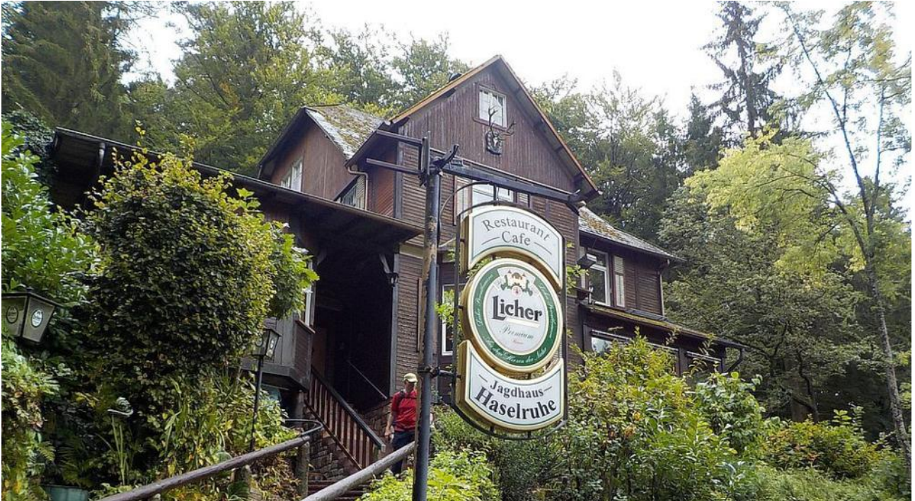
Jagdhaus Haselruhe: Foto von Manni Nitschke 10.219