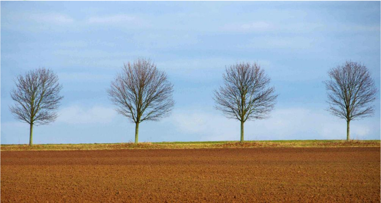
Dieter Deißler: Dez. 2012