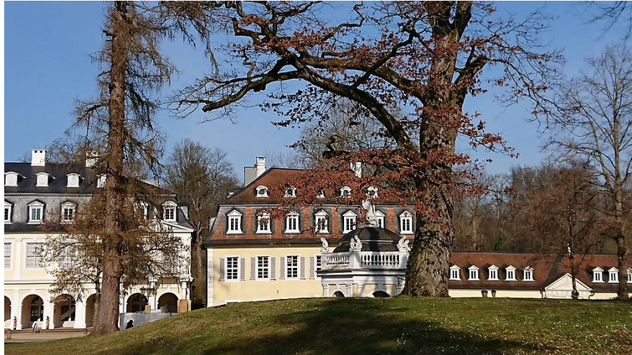
Staatspark Wilhelmsbad; © „Senior_Stoltze“ Febr. 2024

- Wanderung von Hanau-Wilhelmsbad nach Bruchköbel -