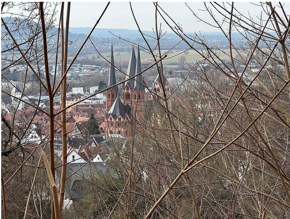
Blick auf Gelnhausen vom Panoramaweg; © PeSchu 2025.03