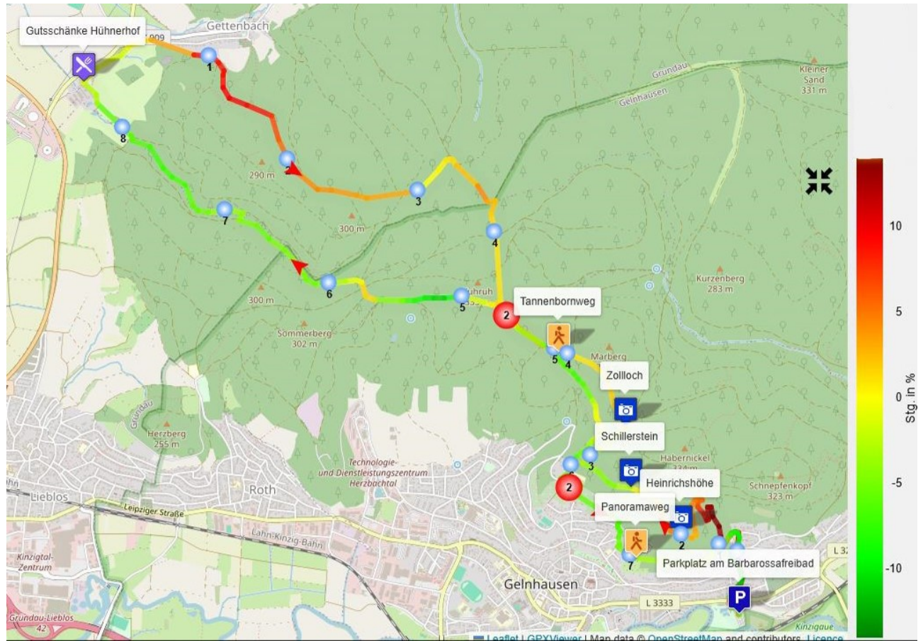
Steigungsprofil - gesamt