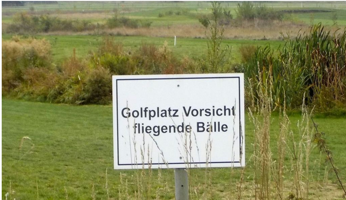
Golfplatz Altenstadt © mannifilm Okt. 2022

- Wanderung von Florstadt zum Golfplatz Altenstadt-