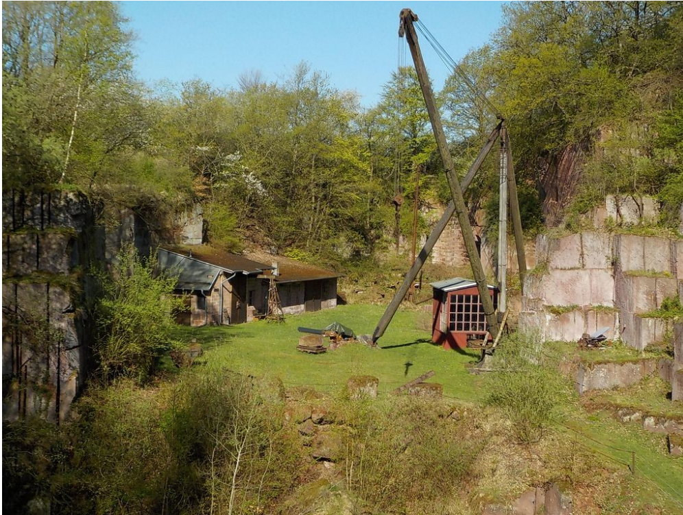
Michelnauer Steinbruch - © mannifilm Apr. 2018

- Wanderung von Nidda-Michelnau nach Nidda-Eichelsdorf -